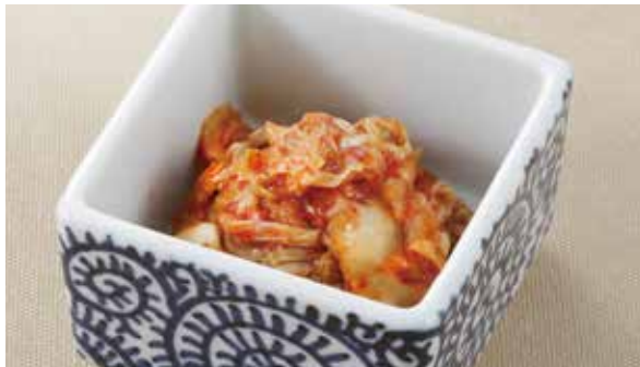
当店で人気のキムチです キムチ 570円 (税込)