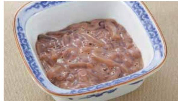
お酒にも、ご飯にも いかの塩辛 570円 (税込)