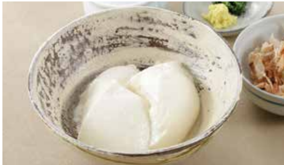
手づくりのお豆腐を是非ご賞味ください 梅の花 自家製 おぼろ豆腐 800円 (税込)