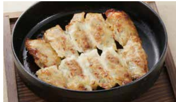
梅の花豆乳入りの餃子を鉄鍋で 鉄板焼き餃子 800円 (税込)