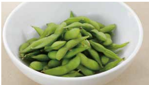
おつまみの定番! 程よい塩加減で 塩ゆで枝豆 570円 (税込)