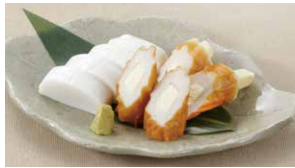
ちょっとしたおつまみに最適 板わさとチーズちくわ 800円 (税込)