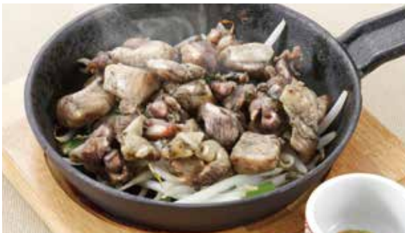
炭火の香りと鶏の旨みがよく合います 鶏の炭火焼き 800円 (税込)