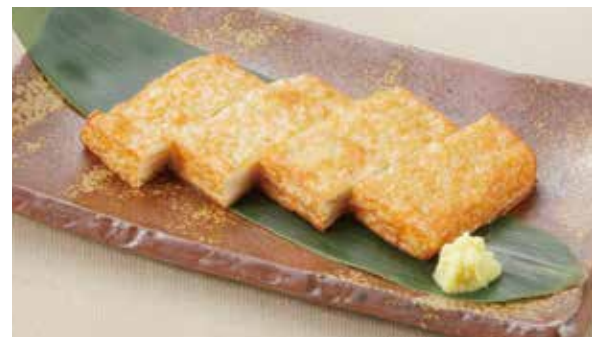
ビールとの相性抜群! 揚げたて角天 570円 (税込)